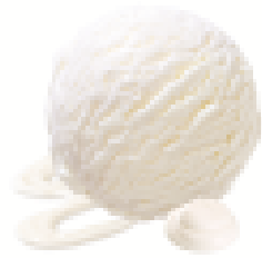
FIOR DI LATTE - SWISS CREAM