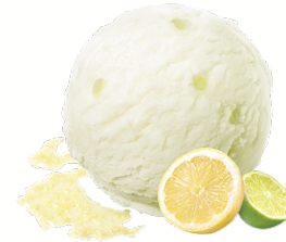
LEMON & LIME