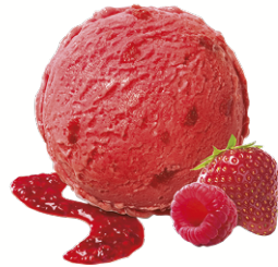
RASPBERRY & STRAWBERRY