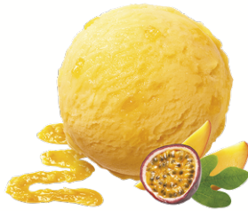
PASSION FRUIT & MANGO